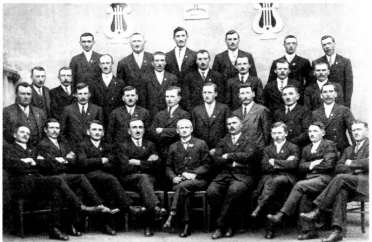
A kátyi evangélikus férfi énekegyesület

Az első világháború idején, 1916 decemberéig Szabadkán szolgált. Több tanügyi cikke megjelent a soproni Evangélikus Népiskola című folyóiratban, a Néptanítók Lapjában, a Csajkás titeli hetilapban, az újvidéki Reggeli Újságban. E két utóbbi újság szépirodalmi alkotásait is közölte, egy ifjúsági színdarabját pedig az Iskolai ünnepeink. Tudósítója volt a Bácsmegyei Függetlenségnek. Működése egész ideje alatt végzett kántori szolgálatot. Több egyesület (titeli tanítói járás kör, temetkezési egyesület, a kátyi földműves egyesület, a kátyi polgári olvasókörnek, könyvtárosa a polgári kaszinónak. 1902-ben megalkototta a kátyi evangé-