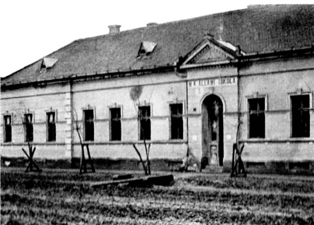
A kátyi iskola

likus férfikart, és huszonöt évig a karmestere volt.